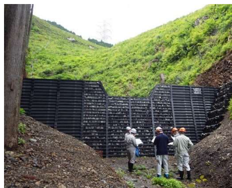
パトロール状況（青梅市）