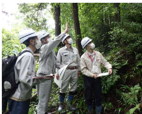
パトロール状況（あきる野市）