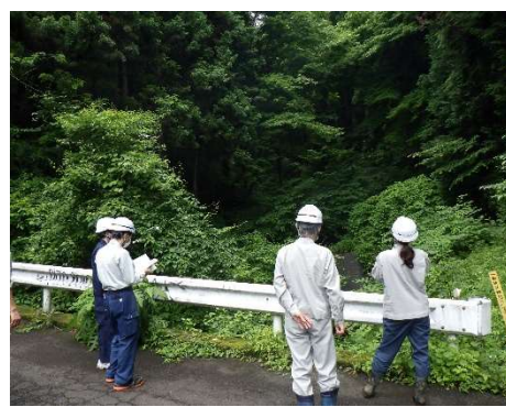
パトロール状況（日の出町）