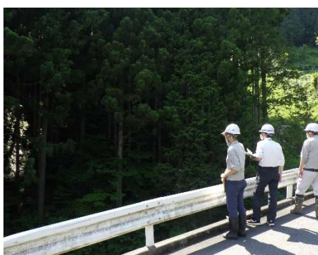
パトロール状況（檜原村）