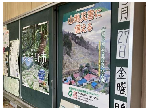
ポスター掲示状況 (観光施設（戸倉しろやまテラス）)