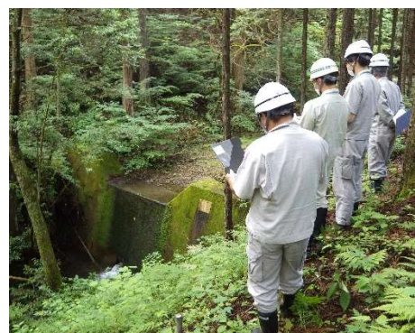
パトロール状況（八王子市）