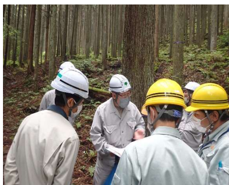
パトロール状況（奥多摩町）