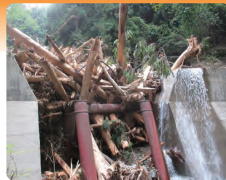
治山ダムが流木を捕捉