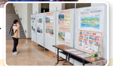
山地災害防止キャンペーンでパネル展開催

国や都道府県では 山地災害 から 地域のみなさんの生命、財産を守る ため、次のような対策を進めています。