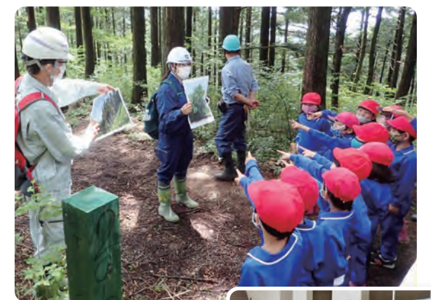
小学生への森林学習

山地災害が一番多いのは梅雨の季節です。このため、林野庁、都道府県や市町村では毎年5月20日から6月30日にかけて山地災害防止キャンペーンを全国的に展開し、住民の皆さんへの山地災害危険地区の周知やパトロール、防災訓練、その他、山地災害に備える広報活動などを行っています。